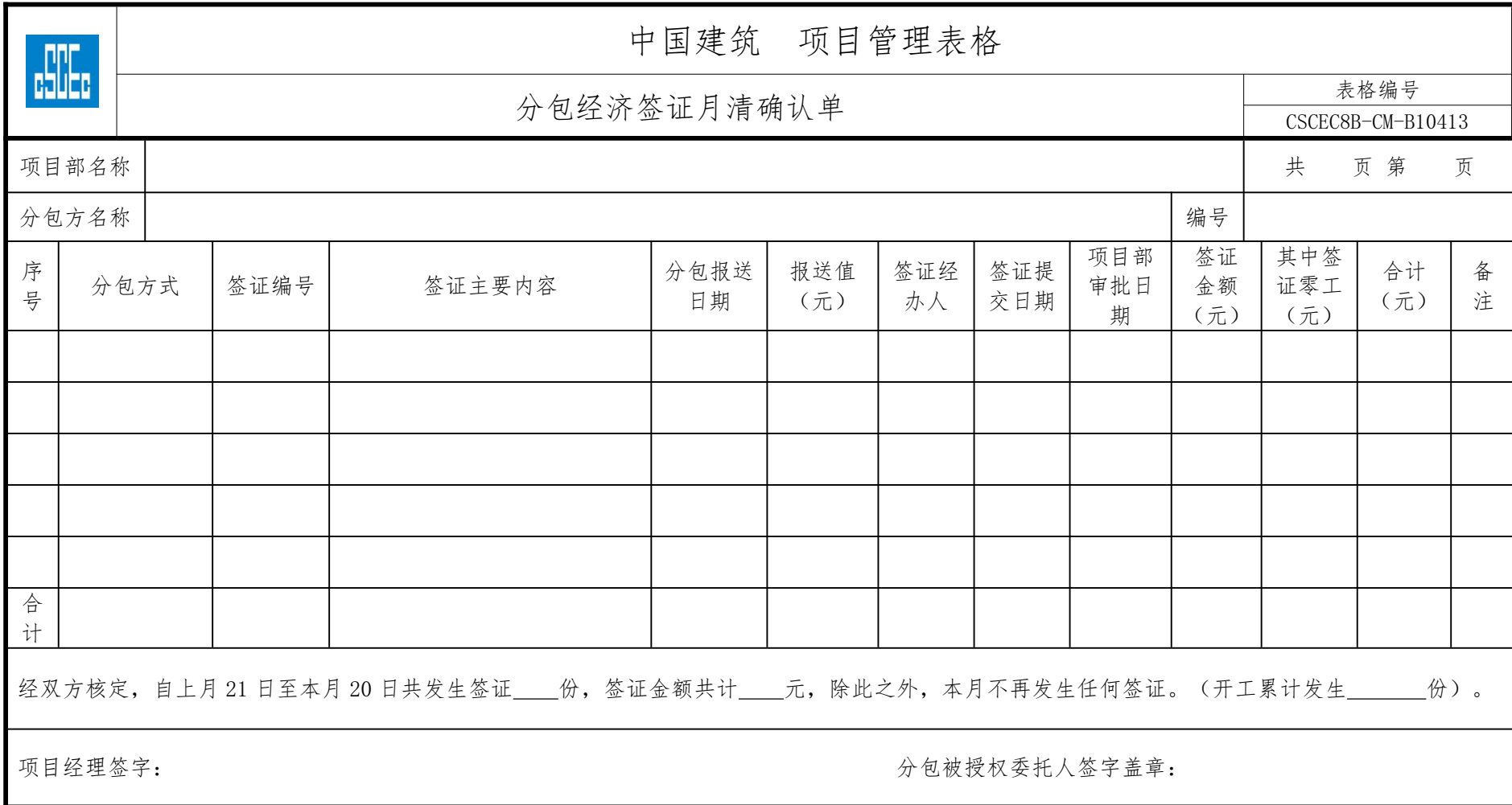
附件十三：《分包经济签证月清确认单》格式